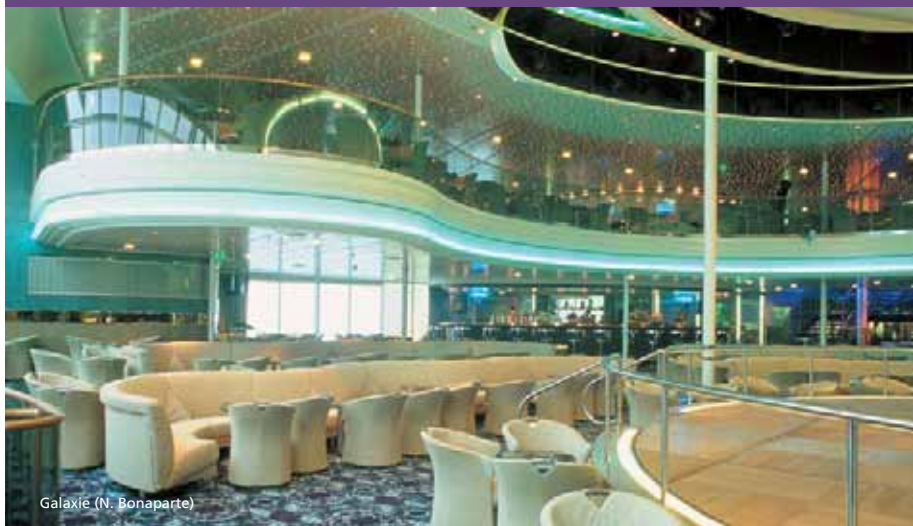
Galaxie (N. Bonaparte)