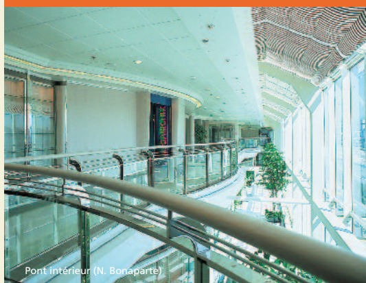
Pont Intérieur (N. Bonaparte)