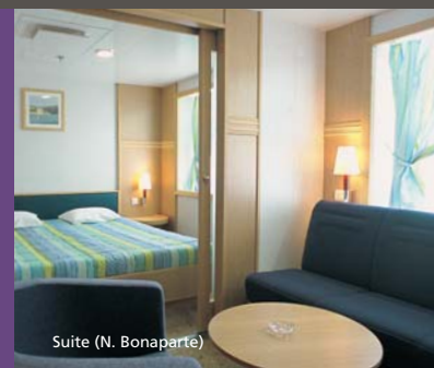
Suite (N. Bonaparte)