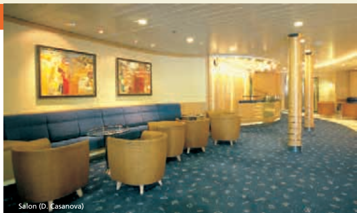
Salon (D. Casanova)