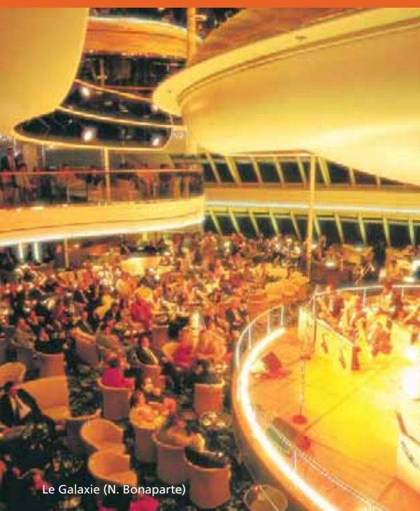
Le Galaxie (N. Bonaparte)