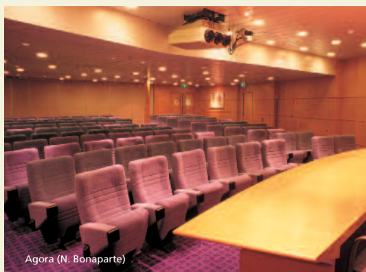
Agora (N. Bonaparte)