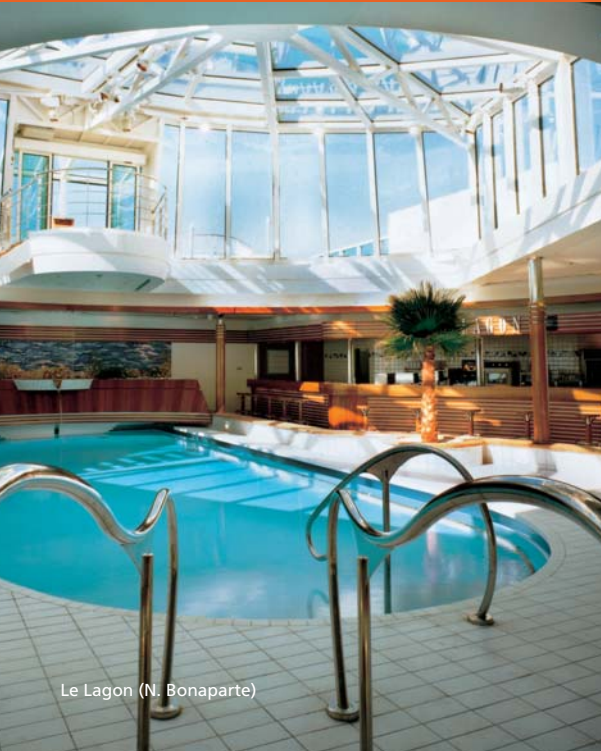
Le Lagon (N. Bonaparte)