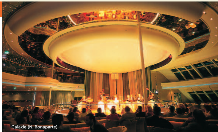
Galaxie (N. Bonaparte)