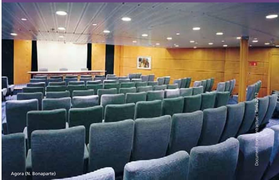
Agora (N. Bonaparte)