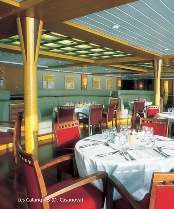
Les Calanques (D. Casanova)